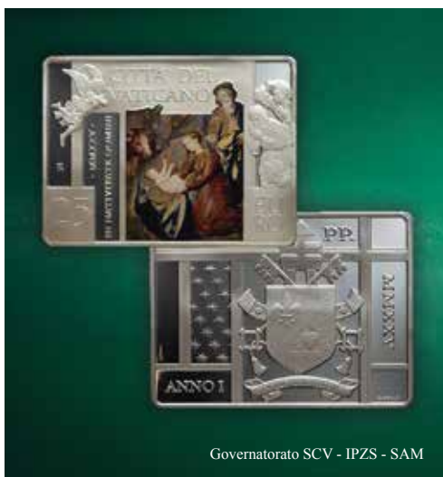
Governatorato SCV - IPZS - SAM