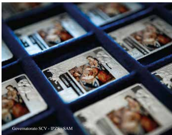
Governatorato SCV - IPZS - SAM

et de maquettes auprès des meilleurs élèves et boursiers de la SAM. L'objet de la sélection : la conception d'une monnaie en argent de 25 euros, de forme rectangulaire avec des éléments en couleur, inspirée de l' Adoration des Bergers — le chef-d'œuvre conservé dans la Galerie des Tapisseries des Musées du Vatican.